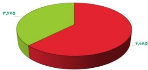
ارزش معاملات خرد و بلوکی

ارزش کل معاملات خرد (بدون بلوک‌ها، اوراق مشارکت و صندوق با درآمد ثابت) ۶,۰۸۵ ارزش کل معاملات معاملات بلوکی، اوراق و صندوق‌های درآمد ثابت ۳,۶۷۵