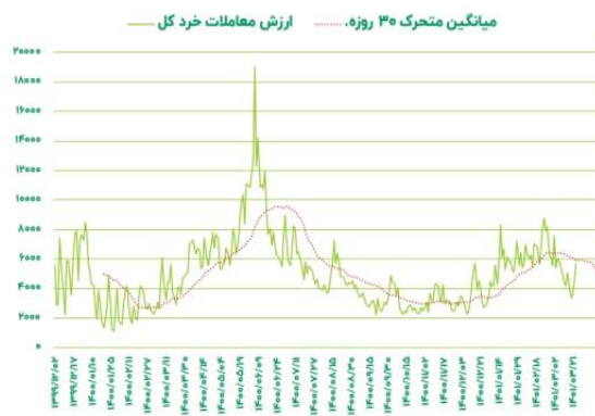
میانگین متحرک ۳۰ روزه، ارزش معاملات خرد کل