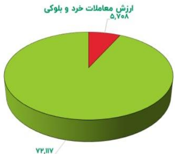
ارزش کل معاملات خرد (بدون بلوک‌ها، اوراق مشارکت و صندوق با درآمد ثابت) ۷۲,۱۱۷ ارزش کل معاملات بلوکی، اوراق و صندوق‌های درآمد ثابت ۵,۷۰۸ ارزش معاملات خرد بورس و فرابورس ۴,۳۶۴